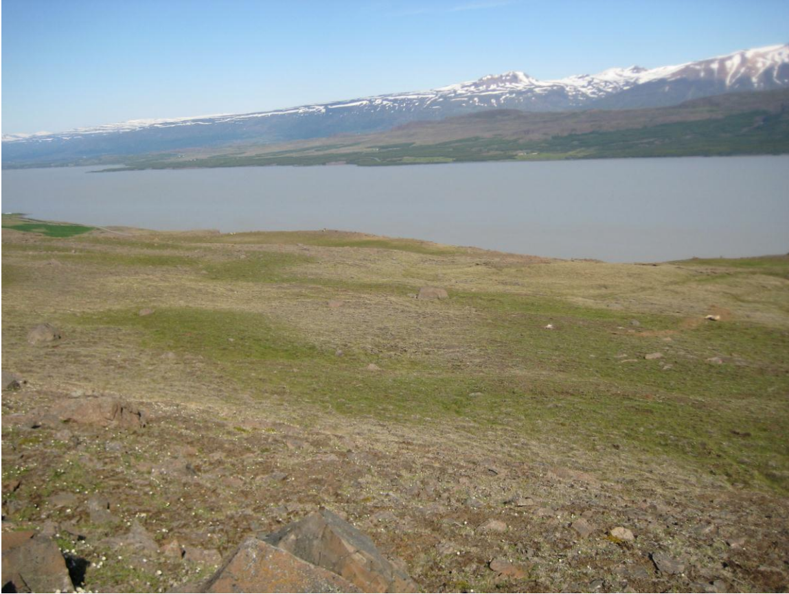
Mynd af árangri áburðardreifingar á Arnheiðarstöðum

Gjaldkeri hefur fylgst með framkvæmdum og metið árangur og er hann mjög góður á þeim svæðum sem tekin hafa verið út.