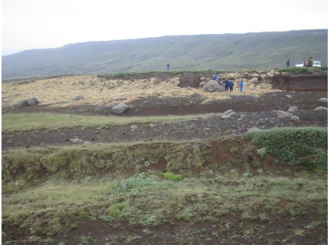
Heypakning í stórt rofabarð. 2003