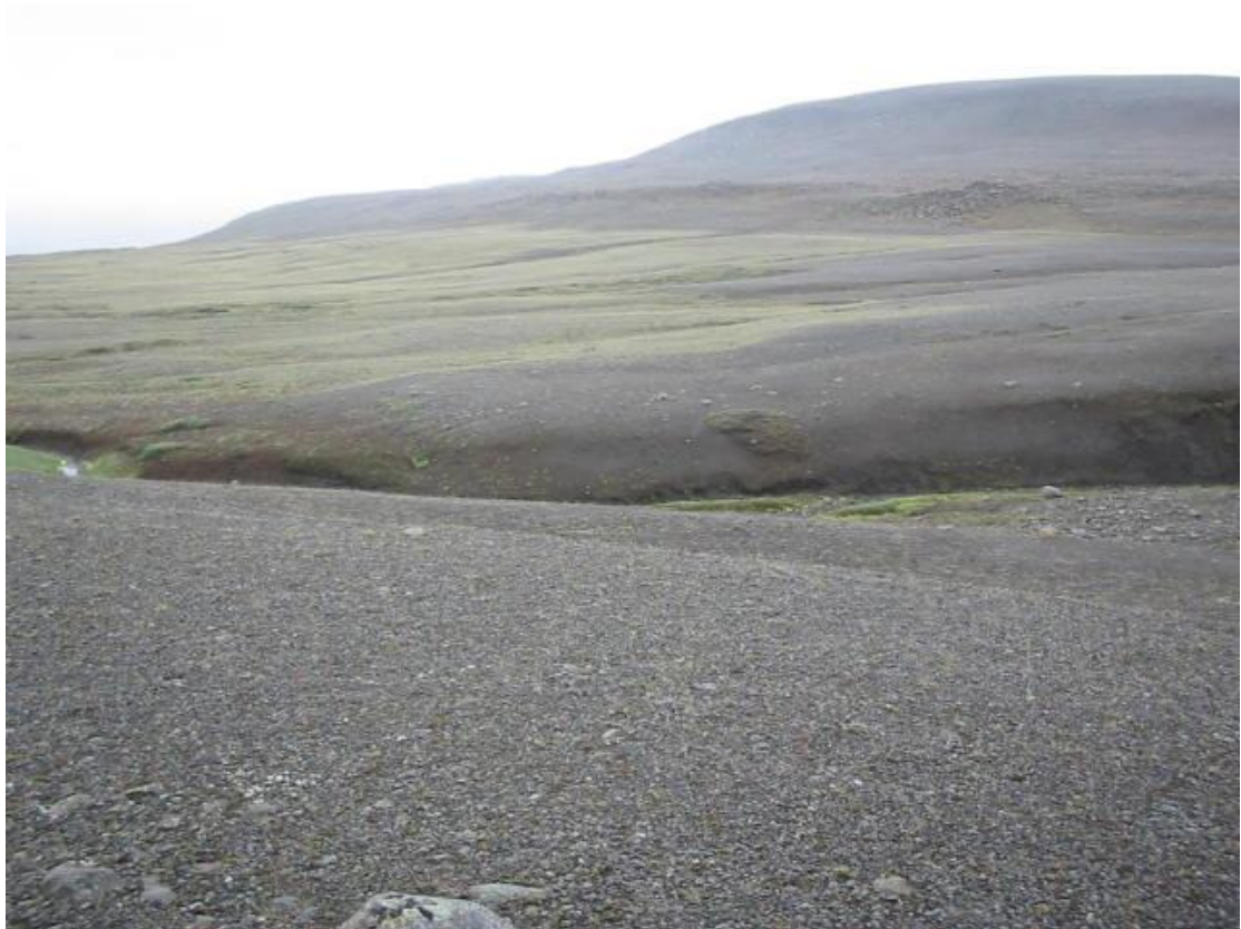
Séð yfir uppgræðslu neðan við Múla. Ljós. Sigvarður Örn Einarsson 2003