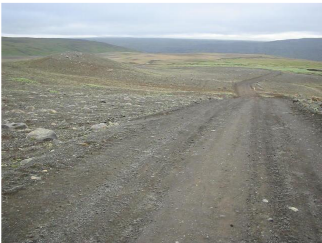
Ofan við Vörðuhraun. 2003