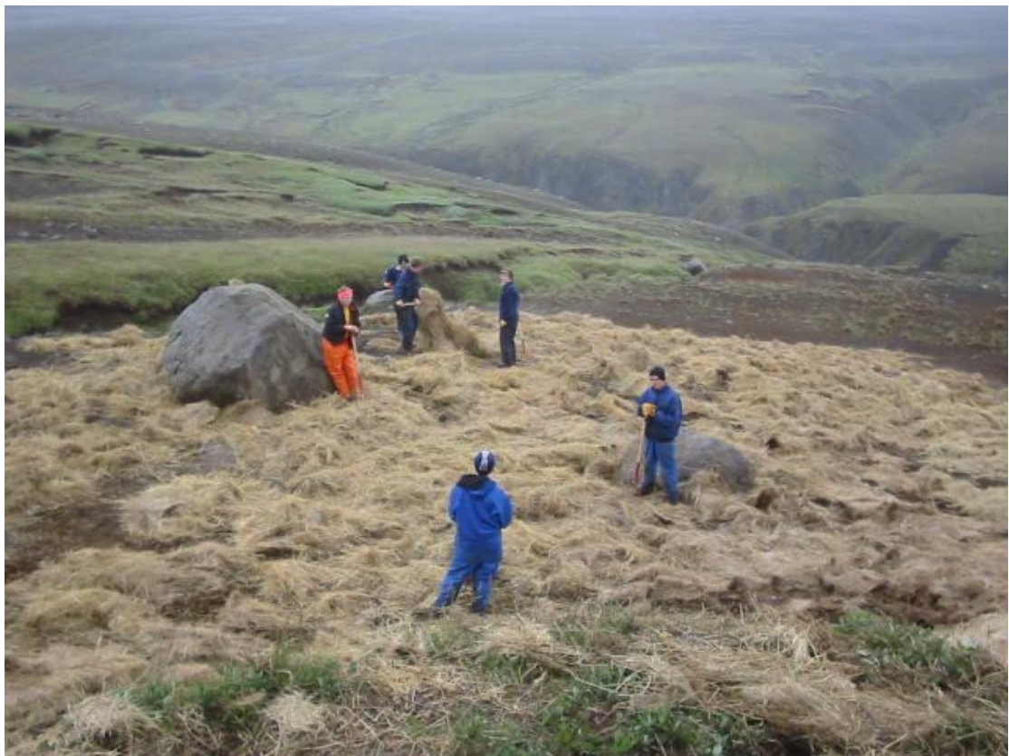
Margar hendur vinna létt verk. . Ljós. Sigvarður Örn Einarsson 2003